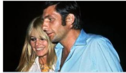
Gunter Sachs und Brigitte Bardot 🔍+

Ohne den gerade verstorbenen Gunter Sachs wäre Saint-Tropez vielleicht immer noch ein Geheimtipp. Der bekannteste Playboy der 60er und 70er Jahre hat den verschlafenen Fischerort an der Côte d'Azur entdeckt und zum Zentrum des internationalen Jetsets gemacht. Ein neuer Bildband macht den „Mythos Saint-Tropez“ sichtbar.